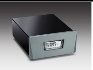
ATH-3 Transformador mc mm