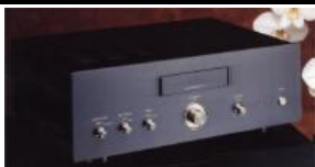
ATE-2 2 phono + 2 lines