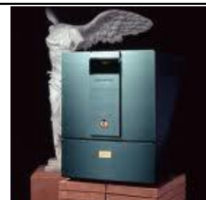
ATM-2001S Etapa Stereofónica de Referencia 2 x 180 W.