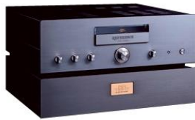
ATE 2001 REFERENCE PHONO PREAMP