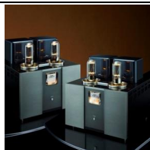
ATM 3211 ETAPAS DE REFERENCIA Configurable clase A ; clase A/B 120w potencia maxima 2 valvulas 211 por canal