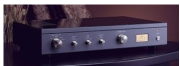
ATC-3 5 líneas