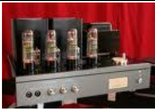
ATM-1S 2*36W (EL34) 2 líneas