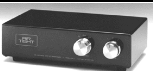
ATH-2a Transformador mc mm