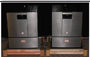
ATM-2001 Reference MONO PAR 2X 330W