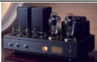
ATM-300 R SIN VALVULA DE SALIDA