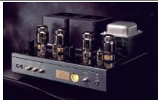
ATM-2 PLUS 70W VALVULAS 6550 NUEVO TRANSFORMADOR TAMURA 2 líneas