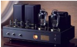
ATM-300 VALVULA TAKATSUKI DE SALIDA