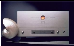
ATM-3 110W mono 55W ultra linear triode (EL34) PAR