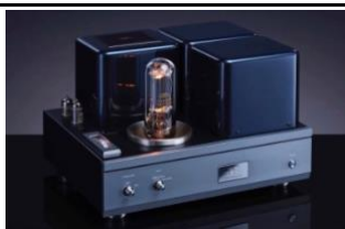
ATM-2211 (new) 32W MONO. 211 PAR