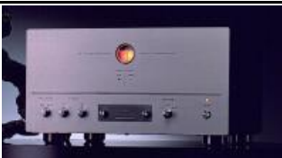
ATM-4 2*24W (mono 48W) 626 2 líneas par mono