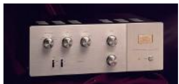
ATC-2 5 líneas + 2 tape