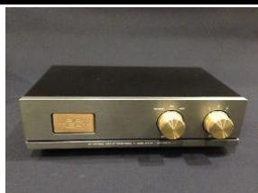
ATH-2 REFERENCE Transformador mc mm