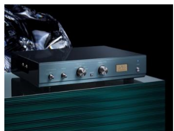
ATC-5 5 líneas + phono