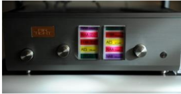
ATE-3011 previo phono de referencia